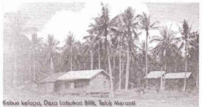
Kebun kelapa, Desa Tabuhan Bilik, Taluk Meranti

Namun pengakuan terhadap FPIC tergantung pada asumsi-asumsi yang dianut. Asumsi tersebut mengenai: siapa pemilik sumberdaya alam, apa hak-hak yang dipunyai oleh pemilik SDA, apa kewajiban para peminjam atau penyewa (orang ketiga). Bila asumsinya negara lah pemilik SDA, bukan rakyat, maka FPIC dianggap tidak diperlukan. Namun bila asumsinya SDA alam sebagian atau seluruhnya dimiliki oleh rakyat maka FPIC diperlukan sekalipun dibatasi oleh konsep tanah berfungsi sosial. Untuk melindungi hak ulayat ini maka penguatan kembali hukum adat menjadi hal yang tak terhindarkan.***