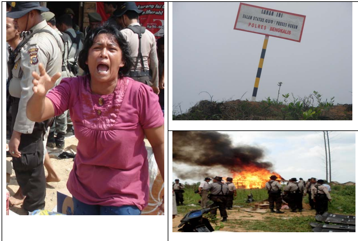
Suasana Pengusiran Paksa warga Suluk Bungkal oleh Kepolisian Riau saat konflik dari PT. Arara Abadi pada 18 Desember 2008

Jika dilihat dari korban yang ditimbulkan, pada tahun 2009 ini juga mencatat konflik yang paling banyak menelan korban meninggal yaitu sebanyak 3 orang dan 16 orang dan luka-luka berat dan ringan yang diakibatkan bentrok antara PT. Sumatera Sylva Lestari, mitra RAPP dengan masyarakat Kampung (Huta) Tangun, kecamatan Bangun Purba Kabupaten Rokan Hulu, yang terjadi pada tanggal 28 Mei 2009. Konflik ini telah ditangani oleh Komisi Nasional Hak Asasi Manusia dan telah disimpulkan berindikasi kuat terjadi pelanggaran HAM. Namun demikian proses hokum terhadap pelaku kekerasan dari pihak perusahaan hingga saat ini tidak diproses oleh Polres Rokan Hulu, kendati pengaduan dari keluarga korban meninggal dan korban kekerasan telah dibuat.