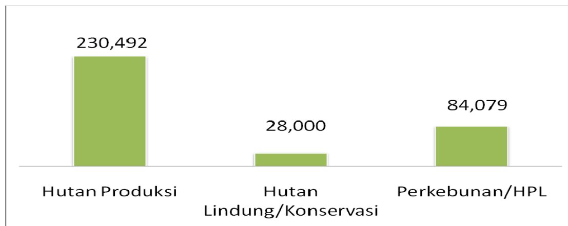
Diagram 2 : Distribusi Konflik Berdasarkan Status Lahan

Sebanyak 67 persen sengketa lahan selama 2010 berada di kawasan hutan produksi. Hal ini tidak berbeda dengan temuan-temuan yang terjadi pada tahun sebelum ini, dimana sebagian besar lahan yang dipersengketakan berada di areal yang berstatus kawasan hutan produksi. Penelitian Litbangdata FKPMR misalnya mencatat bahwa sebanyak 77 persen dari 66 konflik lahan yang terjadi antara masyarakat dengan perusahaan selama tahun 2003-2007 berada diareal yang berstatus kawasan hutan produksi (Litbangdata FKPMR, 2007). Demikian pula studi Scela Up pada 2009, yang melaporkan 75,9 persen konflik terjadi di sektor kehutanan (Scale Up, 2009).