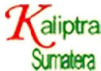
Kaliptra Sumatera, Riau